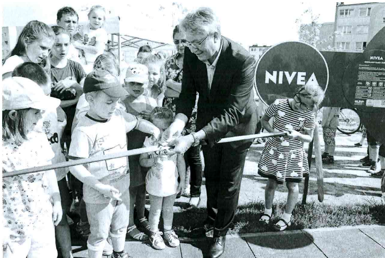
— Srem--_Zdjecia z otwarcia_NIVEA_P_2016 (8).jpg