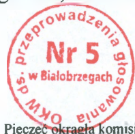
Pieczęć okrągła komisji

Siedziba Komisji mieści się w Zespole Szkół w Białobrzegach, Białobrzegi 75, 16-300 Augustów, tel. 87 644 92 25