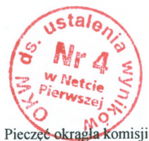
Pieczęć okrągła komisji

Siedziba Komisji mieści się w Szkole Podstawowej w Nettcie, Netta Pierwsza 14, 16-320 Bargłów Kościelny, tel. 87 643 21 67