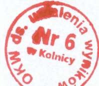
Pieczęć okrągła komisji

Siedziba Komisji mieści się w Szkole Podstawowej w Kolnicy, Kolnica 48, 16-300 Augustów, tel. 87 644 92 95