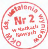
Pieczęć okrągła komisji

Siedziba Komisji mieści się w Szkole Podstawowej Rutki Nowe 1, 16-300 Augustów, tel. 87 644 20 09