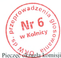
Pieczęć okrągła komisji

Siedziba Komisji mieści się w Szkole Podstawowej w Kolnicy, Kolnica 48, 16-300 Augustów, tel. 87 644 92 95